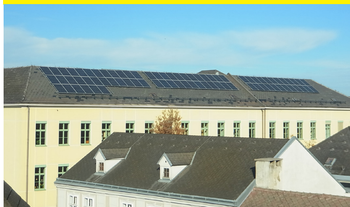
Photovoltaik-Anlage auf dem Schulgebäude, © Gemeinde Ober-Grafendorf

Als wir im Dezember 2020 über Photovoltaik auf den Dächern am Beispiel Ober-Grafendorf berichteten, war dies für die ÖVP kein Thema. Jetzt war es plötzlich anders und der Beitritt zur „Energiegenossenschaft Tullnerfeld“ (kurz EGT) wurde alternativlos und ohne viel Vorinformation durchgezogen. Eine Kurzvorstellung (ohne BürgerInnen) nur für GemeinderätInnen eine halbe Stunde vor Beginn der Sitzung war alles. Obwohl PV-Anlagen auf Dächern uns ein Anliegen sind, hätte mehr Zeit zur Entscheidungsfindung sein müssen, da man sich ja langfristig bindet. Wir enthielten uns daher der Stimme.