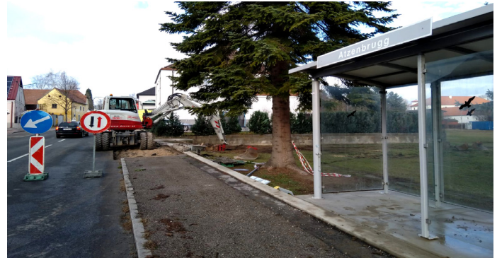
Vorarbeiten für die 2. Zufahrt zum neuen Kindergarten - ohne Verkehrskonzept für die Anbindung an die B43

Nach der Ausschaltung des eigentlich zuständigen Ausschusses für „Familie, Jugend und Bildung“ liegt die gesamte Planung für den Kindergarten seit Herbst 2021 bei einer sogenannte „Vorarbeitsgruppe“ ohne SPÖ. Doch was sie liefert oder besser gesagt nicht liefert, macht uns und den Anrainern Sorge.